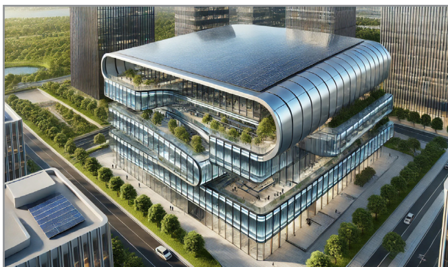
Futuristisches Gebäude mit Perowskit-Solarzellen auf dem Dach und integrierter organischer Photovoltaik an den gekrümmten Fassaden